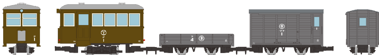
▲ 鉄道コレクション ナローゲージ80 富井電鉄猫屋線 ジ1・ト4・ワフ1 茶