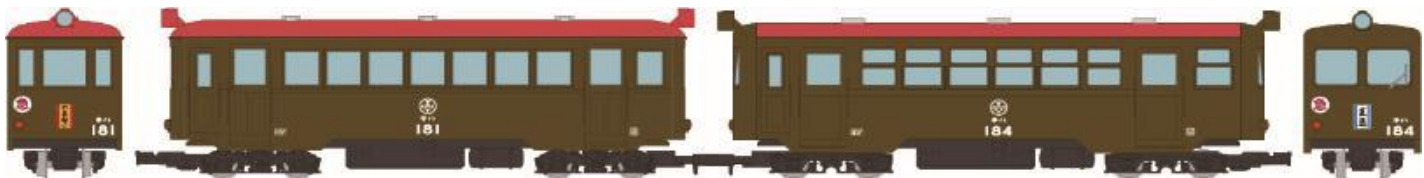
▲鉄道コレクション ナローゲージ80 猫屋線 直通急行「やまねこ」 キハ181・184 2両セット