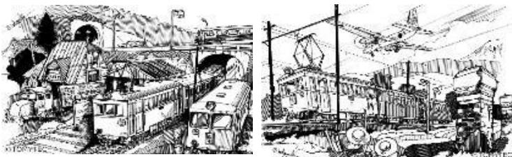
猫屋線第12弾イメージイラスト 作：小林信夫

—御客様へ御案内— 富井電鉄ではこの度、名勝・猫屋溪谷への御行楽へ便利な直通急行「やまねこ」の運行を開始しました。電化・非電化の境界駅である大杉本郷で、先頭車両を電車から気動車へ付け替えますので、大杉本郷駅を通して御利用のお客様は後部の客車車両に御乗車ください。なお紅葉の多客期には気動車も電化区間へ直通し、社町中～大杉本郷間は電車+気動車+客車の併結運転となります。