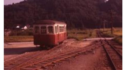
在りし日の尾小屋鉄道金平駅に佇む客車