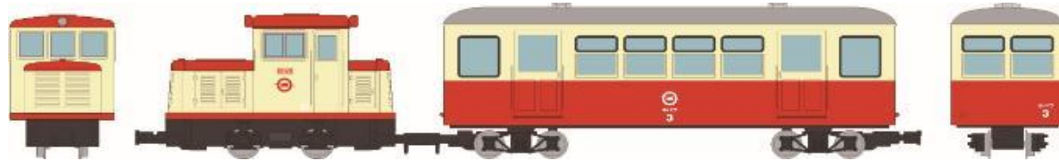
▲鉄道コレクション ナローゲージ80 思い出の尾小屋鉄道 DC121タイプ+ホハフ3タイプ 2両セット