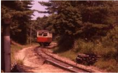
在りし日の尾小屋鉄道キハ1