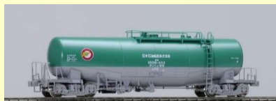
タキ1000形 好評発売中