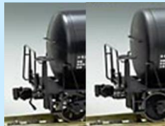
※製品の車輪はボックス輪心となります