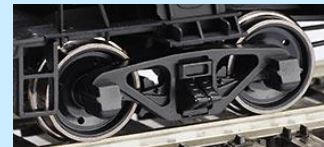
各画像は旧製品です 実際の製品とは異なる場合があります