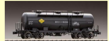
タキ1900形キット 好評発売中