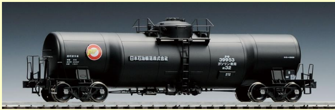
※写真は旧製品の組み立て見本です 実際の製品仕様と異なる場合があります