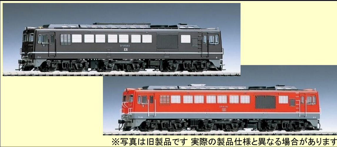
※写真は旧製品です 実際の製品仕様と異なる場合があります