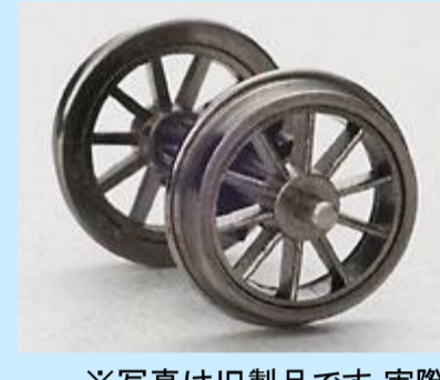
※写真は旧製品です 実際の製品仕様と一部異なります

実車の特徴でもあるスポーク車輪を通電可能な車輪としてスポークもシャープに再現いたします