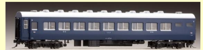
10系客車(青・茶)各種