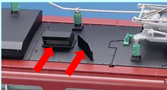
SGダクトと整風板を装備した姿

屋根上のSGダクト・整風板とダクト撤去部のふさがり板は <HO-2019・HO-2020>は選択式 <HO-2515>は国鉄時代をイメージし、SGダクト・整風板取付済み <HO-2516>はJR時代をイメージし、SGダクトが撤去された姿を再現します