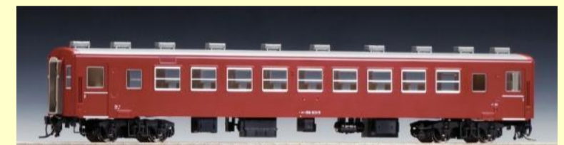
オハフ50形・オハ50形