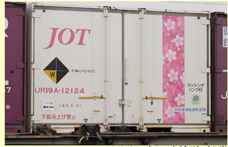
UR19A-12000形コンテナ(日本石油輸送・桜帯)