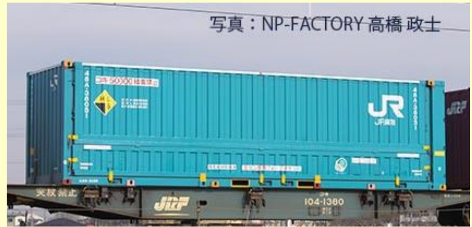
48A-38000形コンテナ(新塗装)