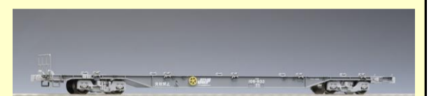
コキ106形 (グレー・コンテナなし・テールライト付) 8月再生産予定