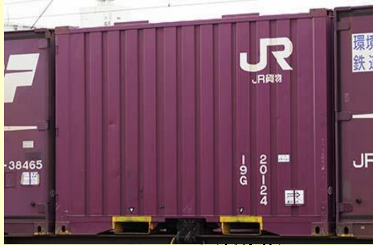
19G形コンテナ(新塗装)