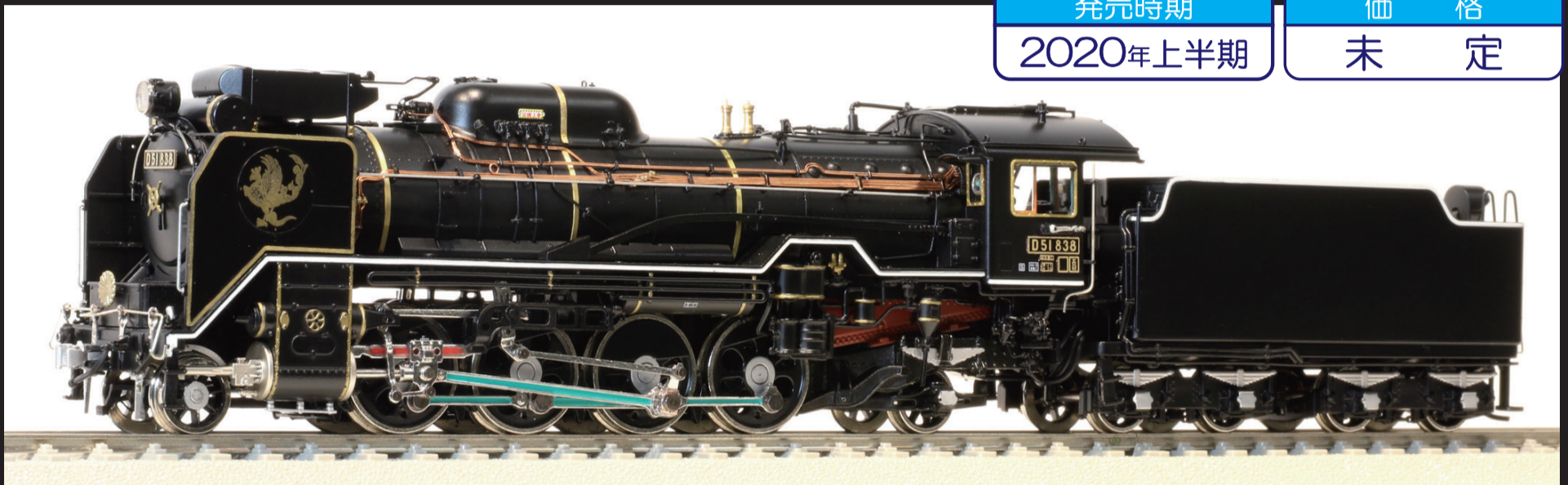
● 838号機 お召仕様 1971年、伯備線でお召列車を牽引した牽引した仕様。