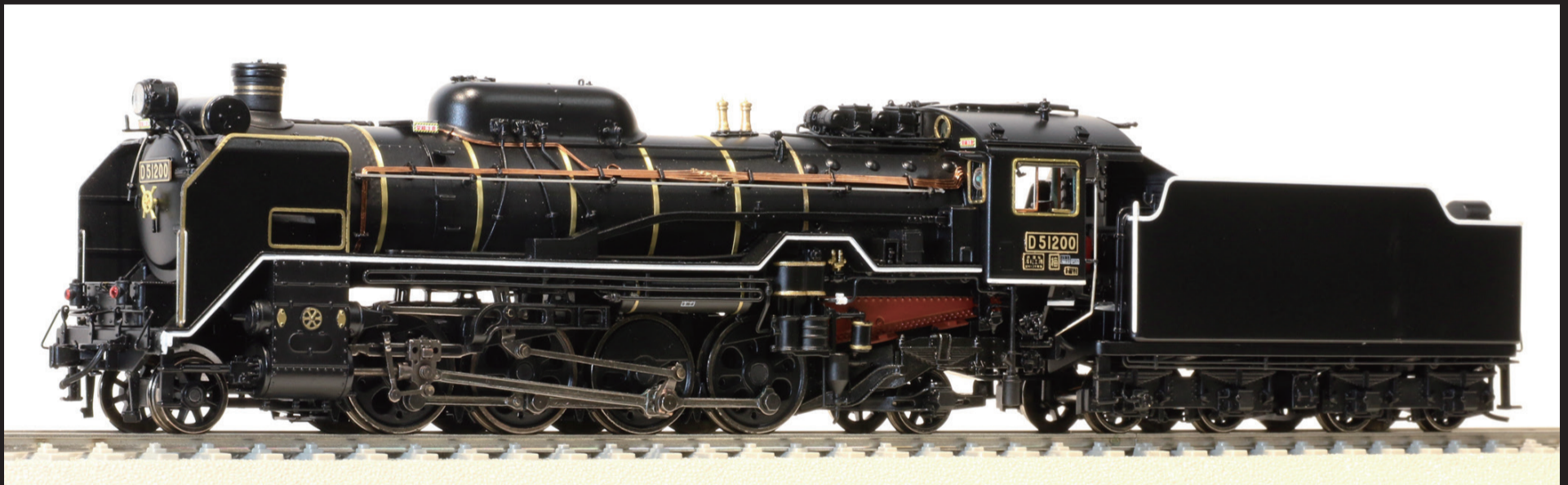
● 200号機 JR西日本仕様 SL『やまぐち』号も牽引する現行仕様。