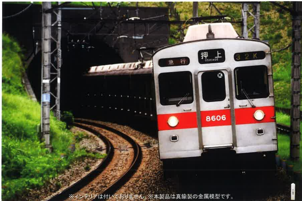
※インテリアは付いておりません。※本製品は真鍮製の金属模型です。