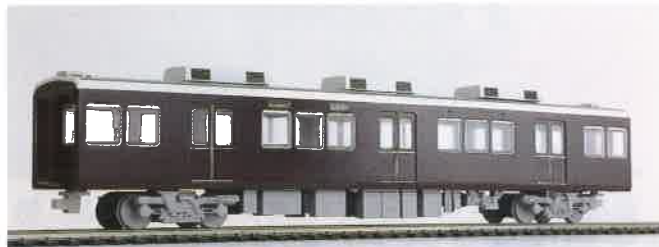
▲8連中4輛含まれる付随車のうち、補助機器を搭載するT1=8550形の作例。中間車2輛セットBは、このT1と補機のないT2=8750形から任意の2輛を製作可能です。