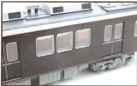
▲側面窓ガラスの枠はガラスパーツとも別パーツとし、塗装後はめ込みが可能です。

での阪急電車自体が初めての商品化なのです。地元関西の方だけでなく、全国的に憧れの対象である気品高いマルーン色の電車を、迫力のスケールでぜひお楽しみください!