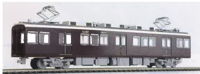
▲パンタ付き電動車のM1=8500形の作例。中間車2輛セットAは、このM1と、同じ電動車でパンタのないM2=8600形が1輛ずつ含まれます。