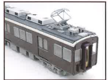
▲配管モールドも実感的。貫通幌や消火器のケースも立体的に表現されます。