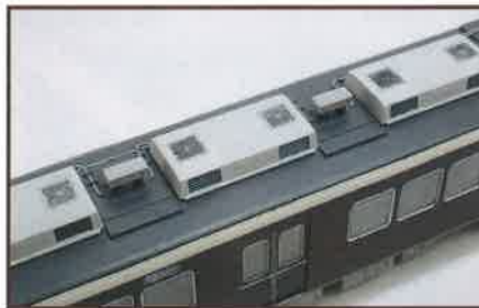
▲各車に3基搭載される分散型クーラーは、側面ルーバーを別パーツによって立体的に再現。