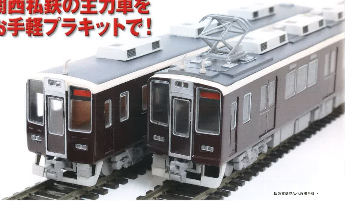
阪急電鉄商品化許諾申請中

右がオリジナルの「額縁前面」、左が増備車に見られる「くの字前面」。屋上アンテナはオリジナルの1本と、能勢電鉄乗り入れ用の2本を選択可能です。 ※「くの字前面」車キットはメトロ科学模型限定流通品です。