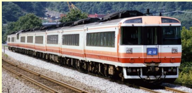
※写真はイメージです 実際の製品仕様と異なる場合があります