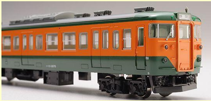
※写真は旧製品です