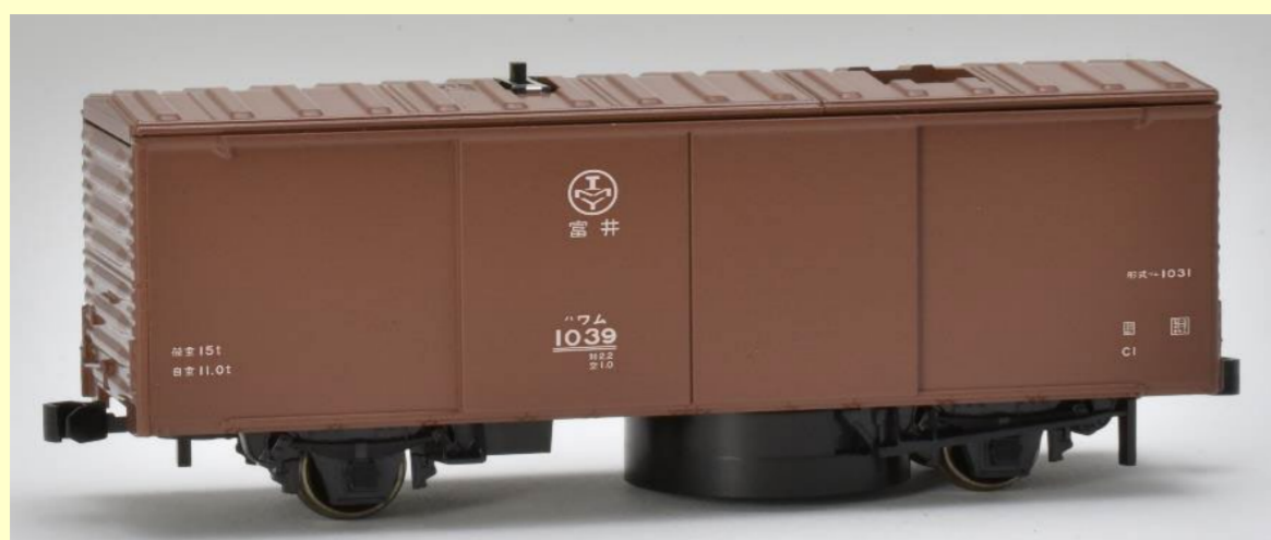
※写真は試作品に画像加工を施したイメージです 実際の製品仕様と異なる場合があります