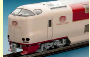
285系(サンライズエクスプレス)