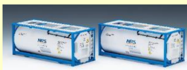
コキ200への搭載におすすめ！ 20ftタンクコンテナ