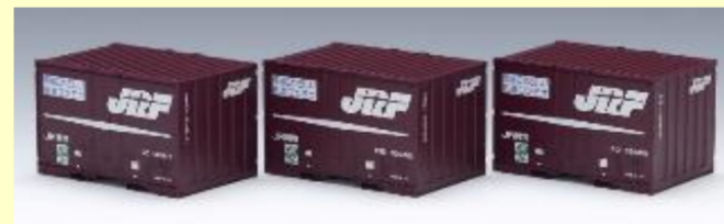
V19C・UR19A 19Dなどコンテナ各種

TOMIXは1/80でも貨車・コンテナ各種をご用意して あなたの鉄道車両増備をお待ちしております