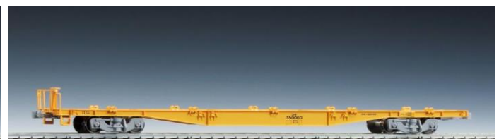
<HO-721> コキ350000形(コンテナなし)