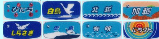
※実際の製品と色など異なる場合があります