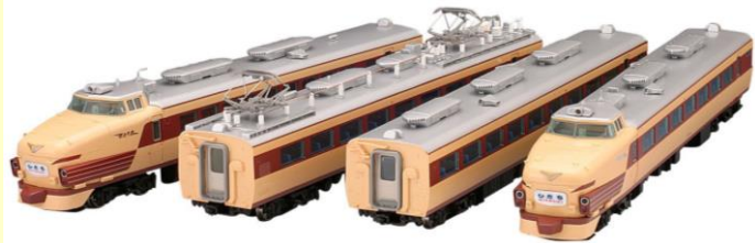
※写真はクロ481-100形が入った旧製品で実際の製品仕様と異なる場合があります