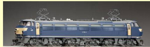
EF66形(JR貨物新更新車) 好評発売中