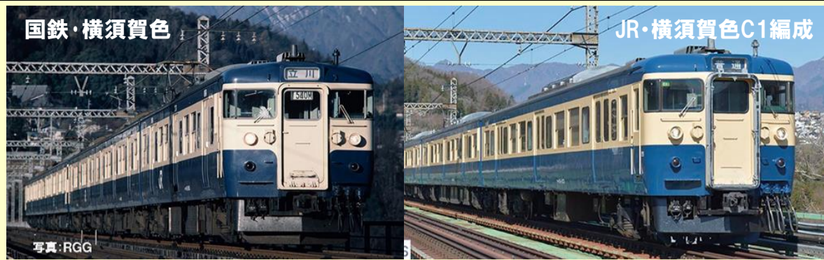
※JRマークと無線アンテナは付属しません