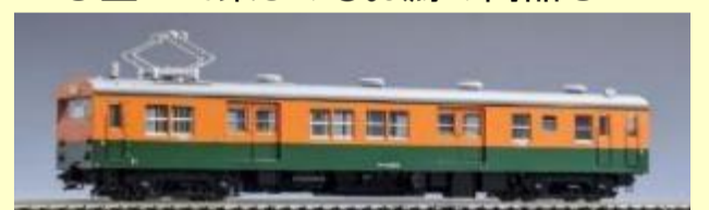
国鉄クモニ83-0形湘南色