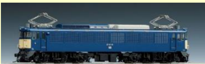
国鉄EF62形 (2次形・篠ノ井機関区)