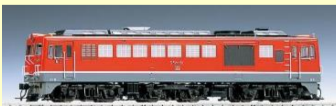
国鉄DF50形 (後期型・朱色)