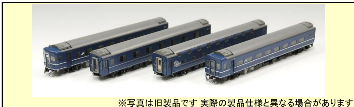
※写真は旧製品です 実際の製品仕様と異なる場合があります