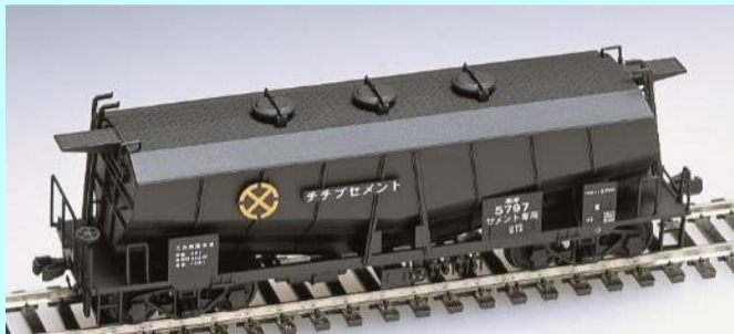
板バネ装備のTR41C台車を装着した秩父セメントのホキ5700

2020年8月発売の<HO-737>タキ1900形組み立てキットと同様パーツの選択によって好みの形態で組み立てることが出来ます