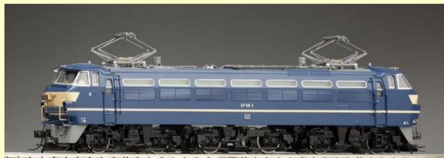
EF66形(前期型・ひさし付) 好評発売中