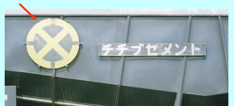
※写真はイメージおよび旧製品です 実際の製品仕様と異なる場合があります