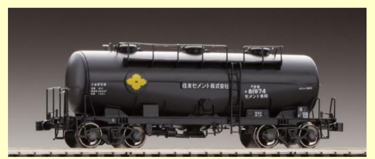
タキ1900形(2両分・組立キットA) 好評発売中