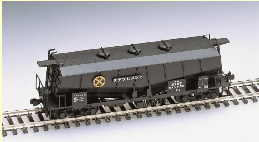
※写真は旧製品です 実際の製品仕様と異なる場合があります