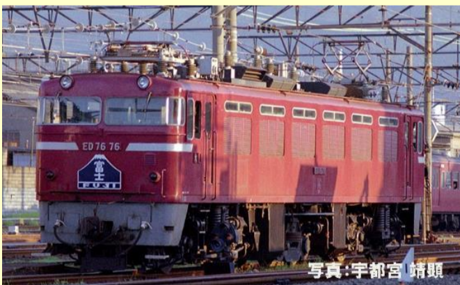
ED76-0形(後期型) 8月発売予定