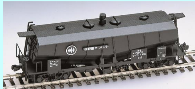
車体中央にスクリーコンベアを装備した小野田セメントのホキ7500タイプ