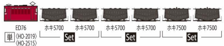
※ホキ7500形はキットに含むパーツにより製作できます。 ※機関車は一例です。