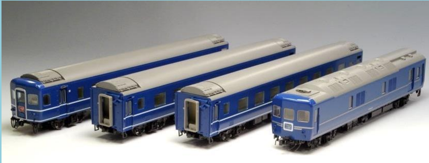
■<HO-9043>国鉄 24系24形特急寝台客車セット