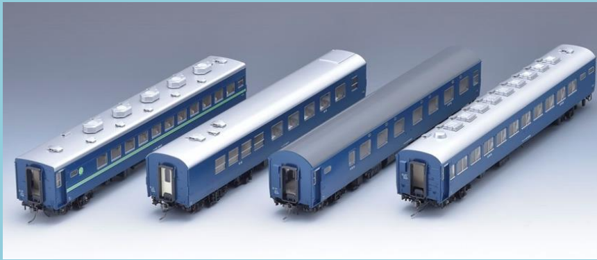
■<HO-9046>10系客車(夜行急行列車)セット