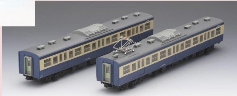
■<HO-9042>国鉄 1131500系(横須賀色) 増結T2両