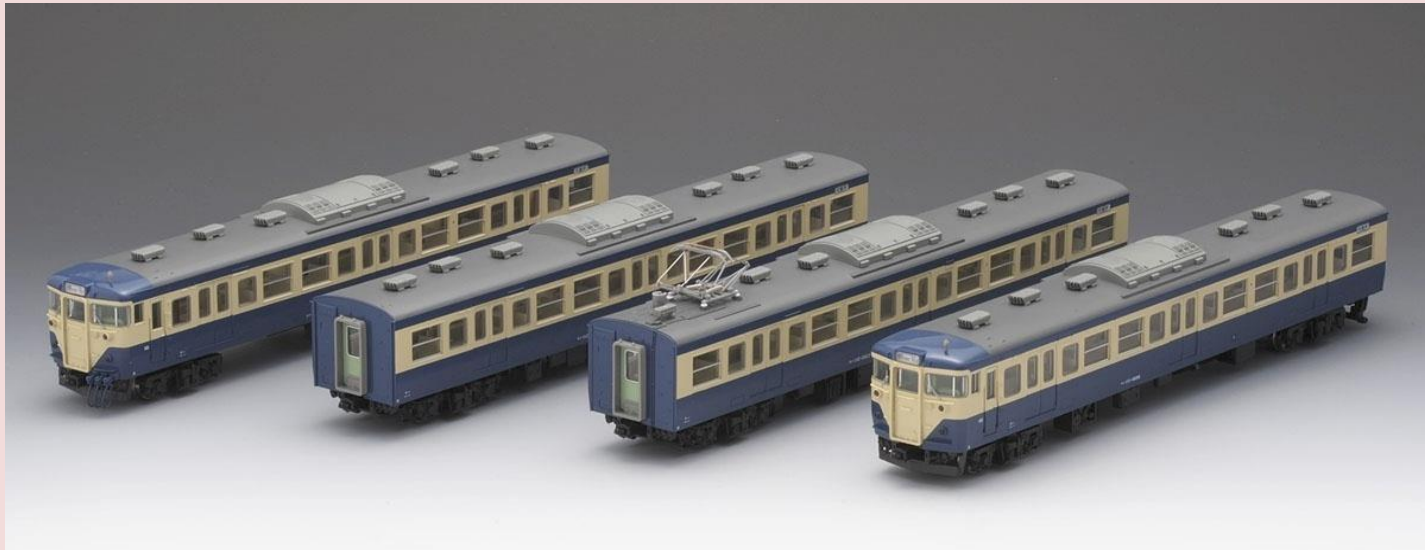
■<HO-9040>国鉄 1131500系(横須賀色)基本4両