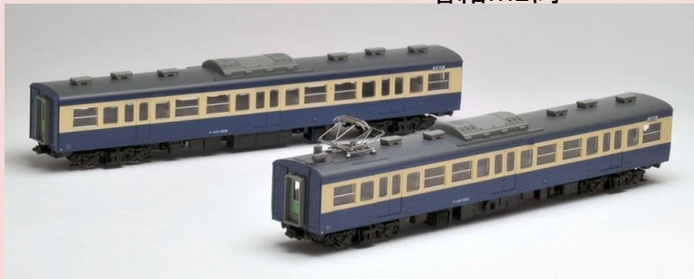
■<HO-9041>国鉄 1131500系(横須賀色) 増結M2両