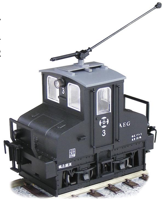
*写真は各部品およびインレタ等を取付けた状態です。

例: プラスチック製 貨車/客車(車両重量約40gの場合)最大4両 推進走行は3両 *牽引する車両や環境により異なります