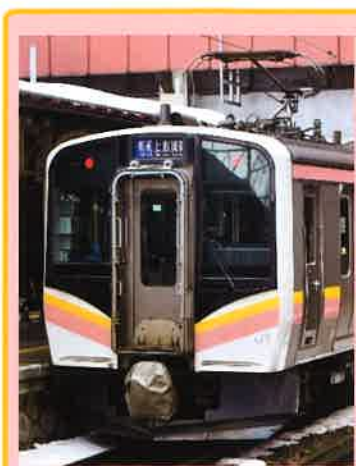
オマケの「パンタ碍子台」で 2基パンタ車も再現可能！ (※取り付け要加工)