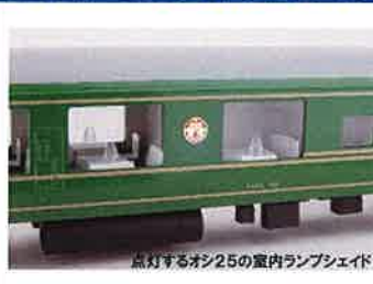
点灯するオン25の室内ランプシェイド