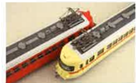
名古屋鉄道株式会社商品化許諾済