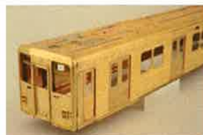
東武鉄道株式会社商品化許諾申請中

● 編成例 東上線編成 8両編成: A(E)セット+B(F)セット【1次車 11801F/11802F】 伊勢崎線編成 6両編成: A(E)セット+C(G)セット【2次車 11604F】