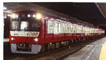
京浜急行電鉄株式会社商品化許諾申請中