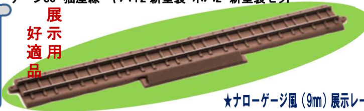
★ナローゲージ風(9mm) 展示レール付:2本