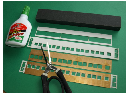
速乾アクリア と サンドペーパー鉋プロ は必携、ペンディングプライヤーはがあると便利