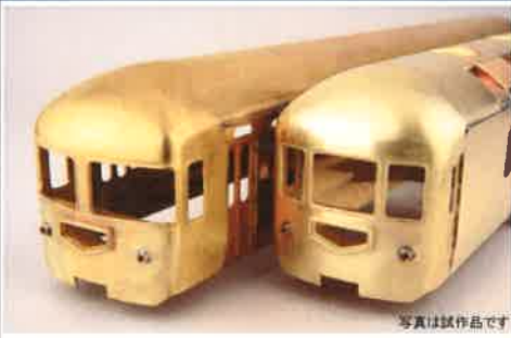
写真は試作品です

今回は20系が一番華やかな活躍をしていた、昭和40(1965)年以降を中心とした時代の編成が組めるよう9形式を製品化します。また製品はお買い求め易いよう9形式を半年ごとの3分割に分け、約1年半に亘って発売いたします。