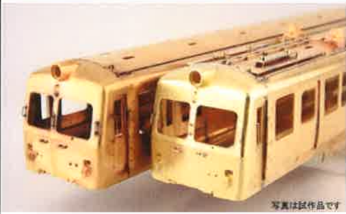
写真は試作品です

前面大型2枚窓、ボディマウント構造が特徴の5000系を製品化します！ <12月発売予定品>