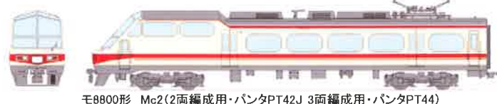
モ8800形 Mc2(2両編成用・パンタPT42J) 3両編成用・パンタPT44)