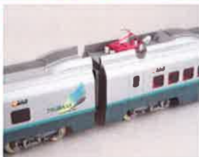
※写真は試作品です

(基本仕様) 車体:エッチングプレス+ロストワックス前面 動力:キャノンEN22高速+ACEギア2600D(WB26.0mm・φ10.5ディスク車輪) 連結器:中間部ACEカプラーⅡ 室内灯:LED仕様白色FLパネルライト(グリーン車は暖色) ヘッドライト・テールライト:LED仕様 座席は下り向き(山形・新庄向き)