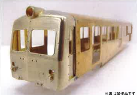
写真は試作品です

前面大型2枚窓、ボディマウント構造が特徴の旧5000系を製品化します！ <11月発売予定品>