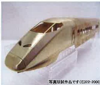
写真は試作品です(E322-2000)