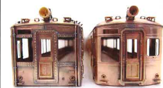
写真は試作品です

「クモハ52 広窓 飯田線時代(4両編成)」に続く旧型国電シリーズ第2弾！ <10月発売予定品>