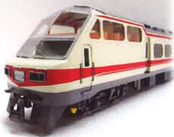
※写真は前回製品です

■完成品 3両編成セット 価格未定 □キット 3両編成セット 価格未定 モ8800形(Mc1・M車)+サ8850形(T)+モ8800形(Mc2) ※サ8850形の座席は改装後(リクライニングシート)の仕様