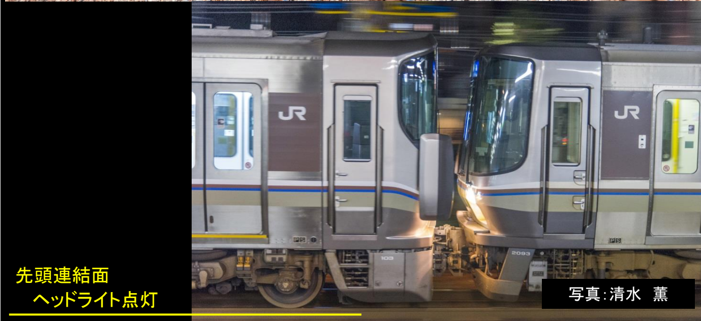
先頭連結面 ヘッドライト点灯