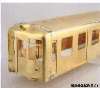
※画像は試作品です

初期車は初めての製作になります <川崎車輛製 昭和34年製造車...6月発売予定品>