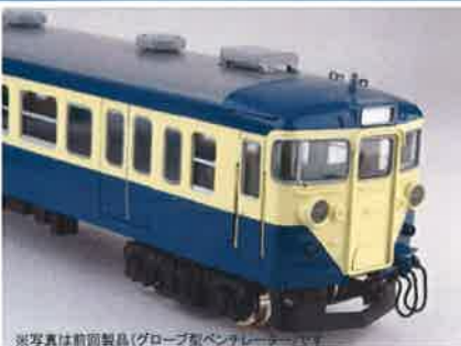
※写真は前項製品(グローブ型ベンチレーター)

人気の113系横須賀色に「押込型ベンチレーター」タイプを製品化します! <3月発売予定品>