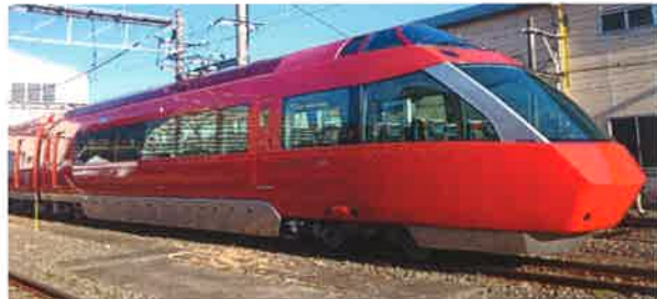
小田急電鉄商品化許諾申請中