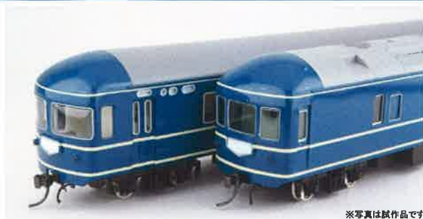
※写真は試作品です

今回から新規設計になり、車体の塗装(青15号)は「艶有り」になるなど大幅なリニューアルで再登場です。 <好評発売中!>