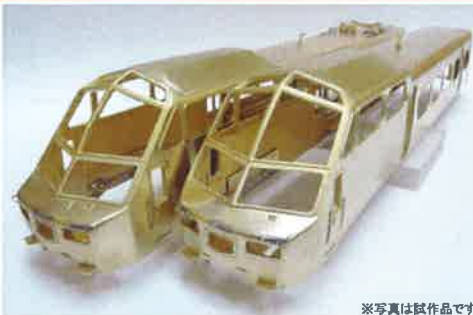
※写真は試作品です

ハイデッカーの最前部はロストワックス製! 完全新規設計で再登場します! <1月~2月発売予定品>