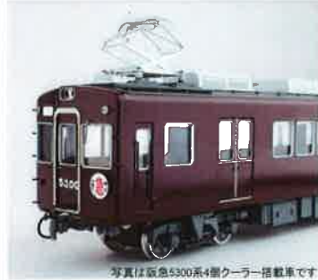
写真は阪急5300系4個クーラー搭載車で

まもなく発売となります！ 4個クーラー搭載車との混成編成でお楽しみください！ <9月発売予定品>