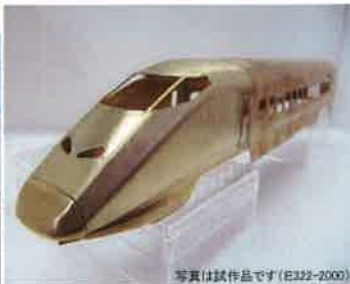
写真は試作品です(E322-2000)

(基本仕様) 車体:エッチングプレス+ロストワックス前面 動力:キャノンEN22高速+ACEギア2600D(WB26.0mm・φ10.5ディスク車輪) 連結器:中間部ACEカプラー II 室内灯:LED仕様白色FLパネルライト(グリーン車は暖色) ヘッドライト・テールライト:LED仕様 座席は下り向き(山形・新庄向き)