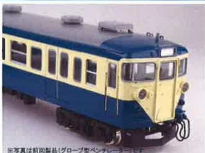
※写真は前号製品(グローブ型ベンチレーター)です

人気の113系横須賀色に「押込型ベンチレーター」タイプを製品化します！ <3月発売予定品>