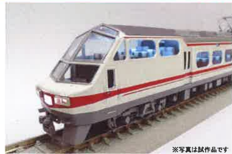
※写真は試作品です

日本で初めて最前部の展望席をハイデッカー構造とした車両で、昭和59(1984)年に「パノラマDX」として2両(モ8800形)2編成が登場しました。平成元(1989)年には中間車(サ8850形)が増備され、同年7月からは3両編成で運行後、平成17(2005)年に惜しまれつつ全車両が廃車されました。今回は1次車をプロトタイプに「登場時2両編成セット」と「晩年時3両編成セット」の2種類を完成品とキットで発売いたします。