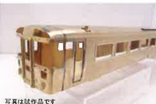
写真は試作品です

キハ183系7550・8550番台は、キハ281系「スーパー北斗」登場により130Km/h運転に対応すべく改造された2550・3550番台の走行用機関をさらに換装させたタイプです。現在も特急「北斗」限定で運用されています。製品は、基本となる5両セットと増結用の中間車キハ182-7550(T)の2種類での発売です。