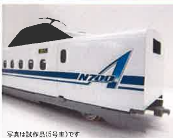
写真は試作品(5号車)です

「N700A」はN700系の性能をさらに進化させた車両で、「A」はAdvanced＝進化したの頭文字です。車体側面のロゴはデカール表現です。製品は全16形式で単品販売いたします。