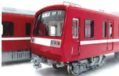
写真は試作品です