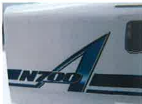
写真は試作品です

「N700A」はN700系の性能をさらに進化させた車両で、「A」は「Advanced=進化した」の頭文字です。車体側面のロゴは印刷にて表現する予定です。製品は全16形式で単品販売いたします。