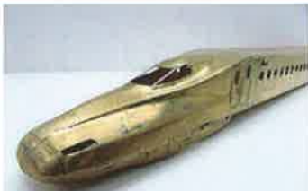
写真は試作品(16号車)です