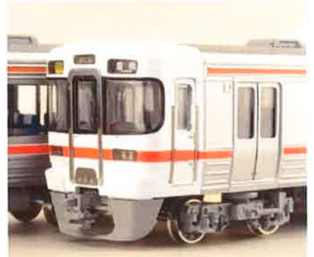
1700番台 方向幕・快速/天竜峡