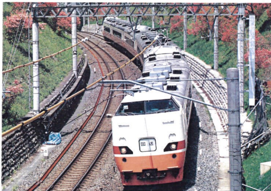
JR東日本商品化許諾済