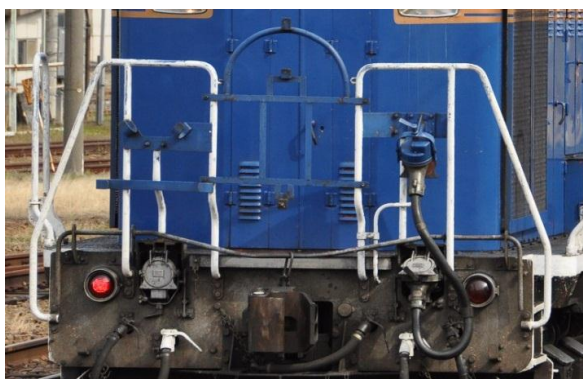
■前面手すりとヘッドマークステータ