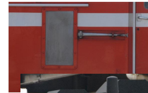
■タブレットキャッチャーと受けゴム