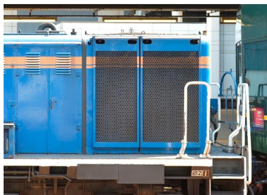
■ボンネットラジエーターは2分割スタイル