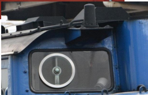
■旋回窓・無線アンテナ